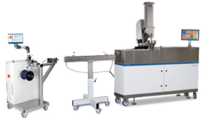
Compoundieranlage mit TwinLab-C 20/40 mit Rundstrangdüsenkopf, Wasserbad und Wickler