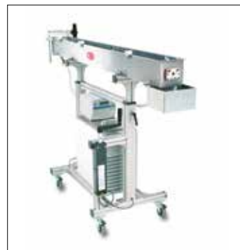
AquaTrough – Brabender CWB Wasserbad